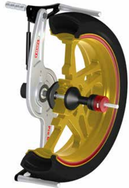
ProBike in azione.