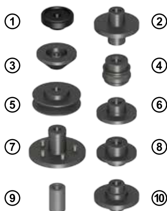
Kit di espansione per bracci oscillanti mono-croce Cod. art. 815 008 003