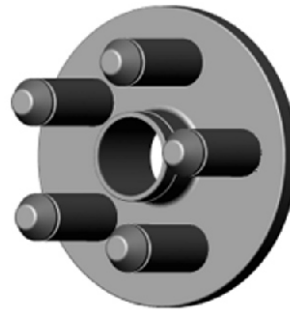
Typenspannplatte 5x130 250 105 400